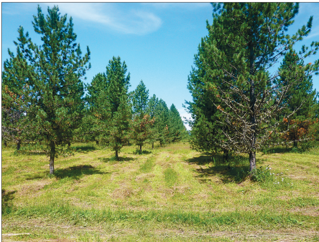
Рис. 3. Повреждение хвои через два года (2013 г.).